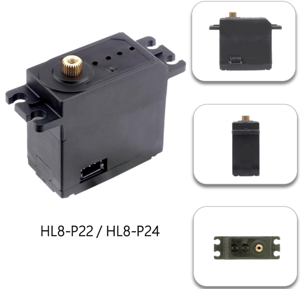
HL8-P22 / HL8-P24